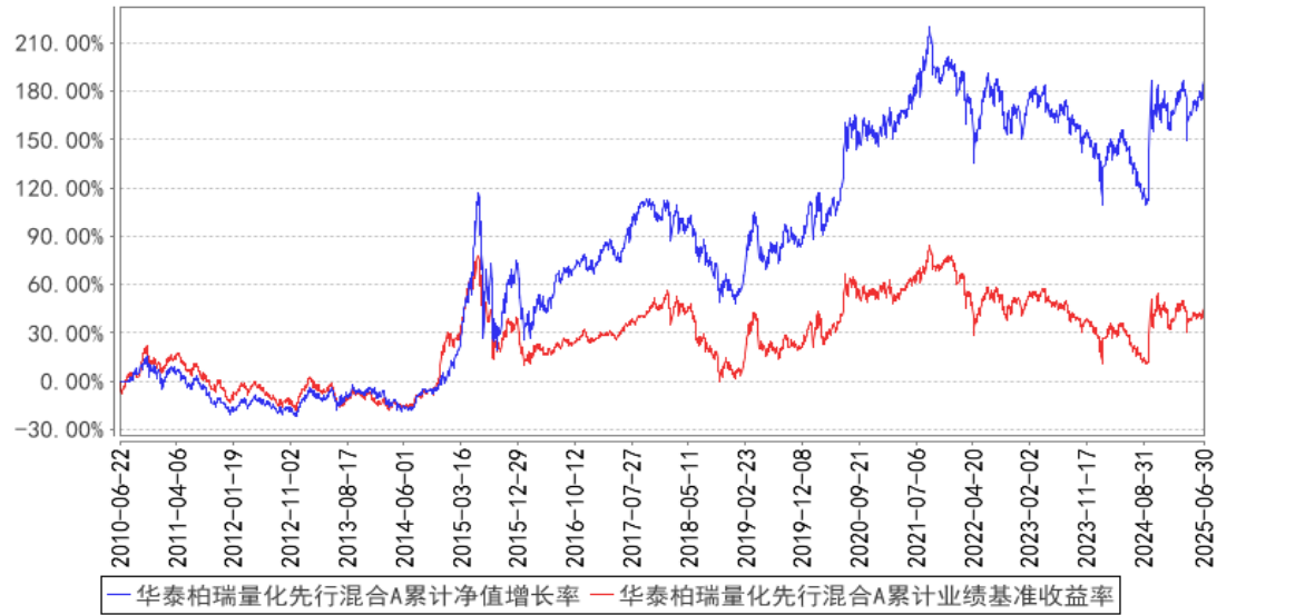
华泰柏瑞量化先行混合A累计净值增长率与同期业绩比较基准收益率的历史走势对比 图

注：本基金于 2020 年 9 月 28 日新增 C 类份额，C 类指标计算日期为 2020 年 9 月 28 日至 2025 年 6 月 30 日。