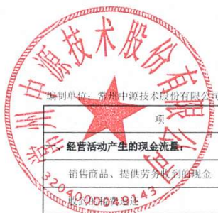
合并现金流量表 2025年1-4月