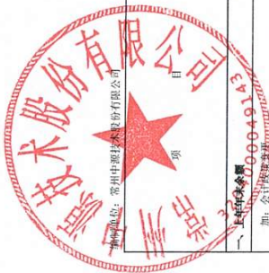
合并股东权益变动表 2023年1-4月