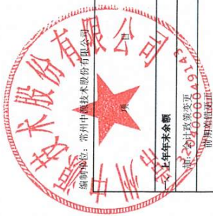
母公司股东权益变动表 2025年1-4月