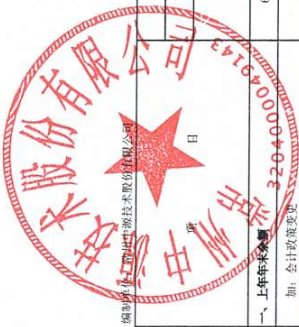
合并股东权益变动表(续) 2023年1-4月