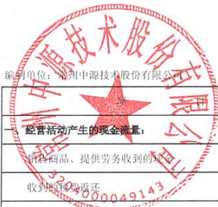
母公司现金流量表 2025年1-4月