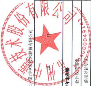
母公司股东权益变动表 (续) 2025年1-4月