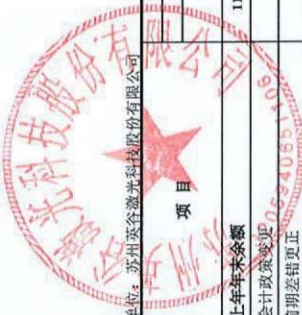
合并所有者权益变动表