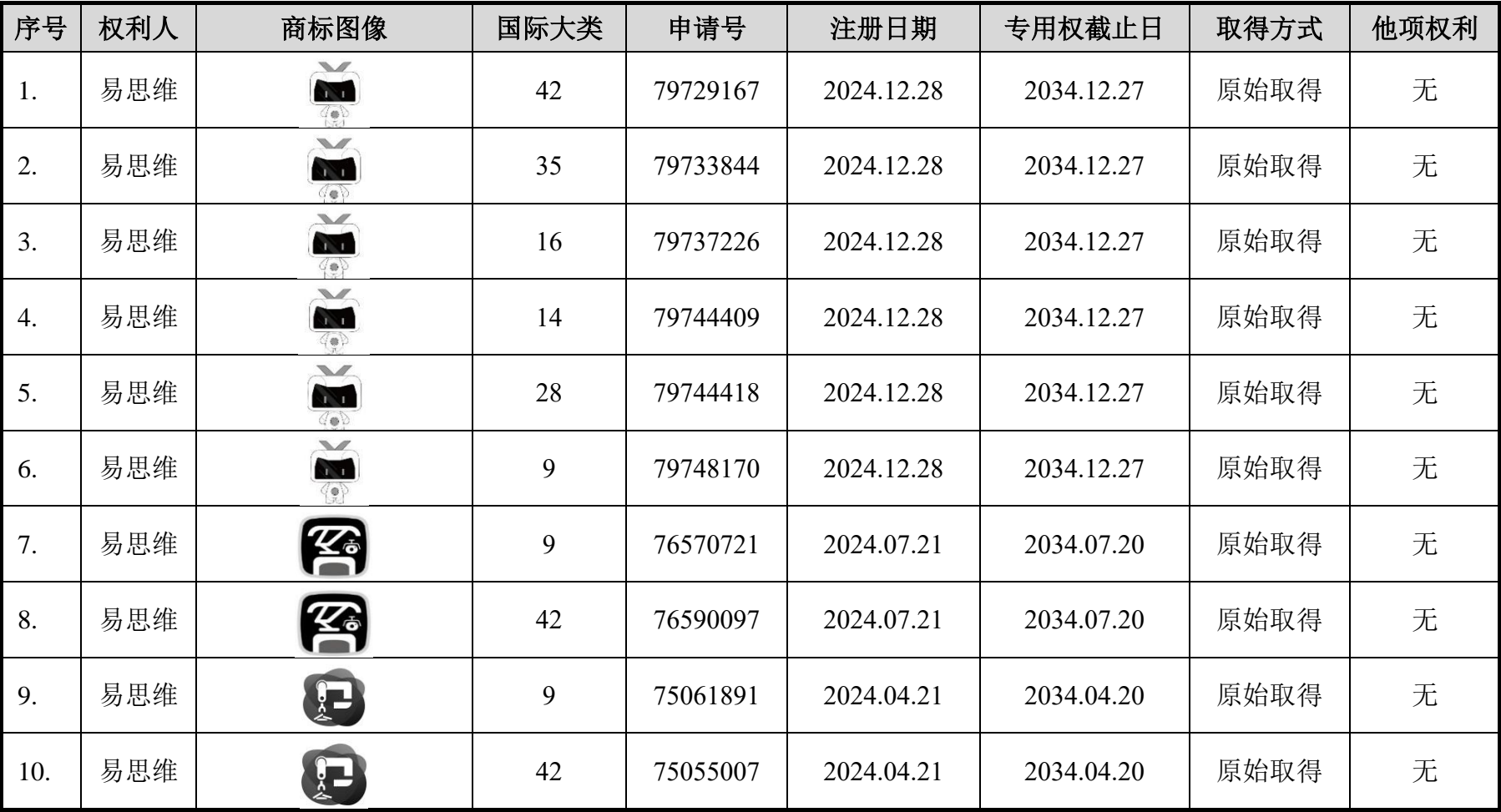
表一 发行人及其控股子公司已获授权的境内商标