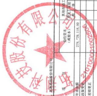
母公司所有者权益变动表