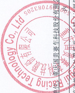
非经常性损益明细表