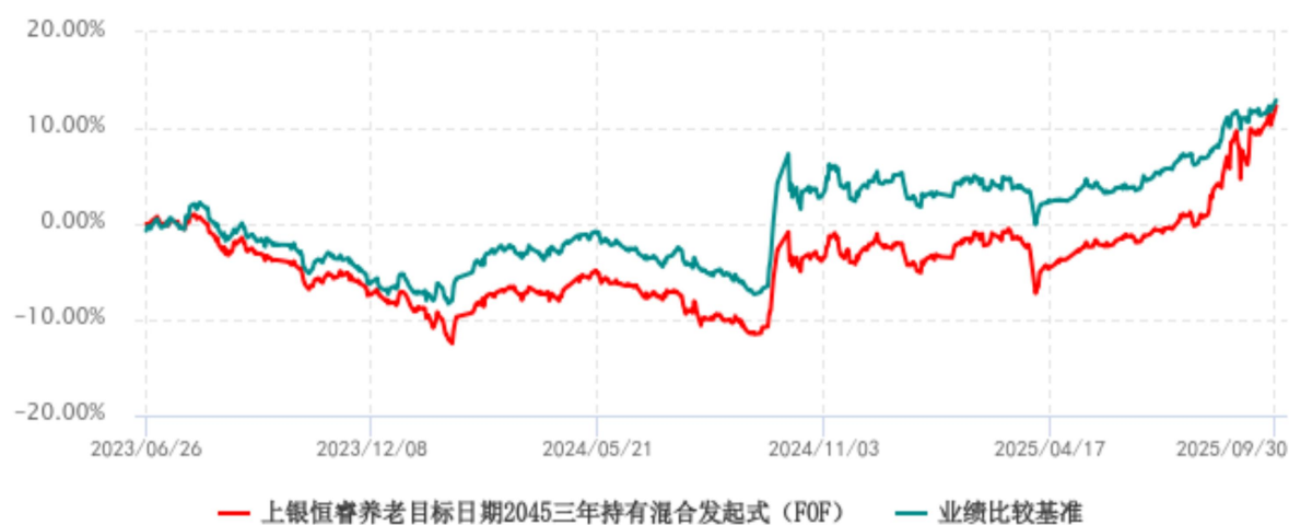
上银恒睿养老目标日期2045三年持有期混合型发起式基金中基金（FOF）累计净值增长率与业绩比较基准收益率历史走势对比图 (2023年06月26日-2025年09月30日)

注：本基金合同生效日为 2023 年 06 月 26 日，自基金合同生效日起 6 个月内为建仓期，建仓期结束时各项资产配置比例符合基金合同约定。