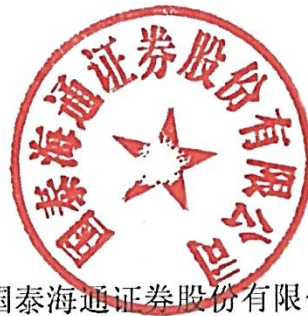
国泰海通证券股份有限公司