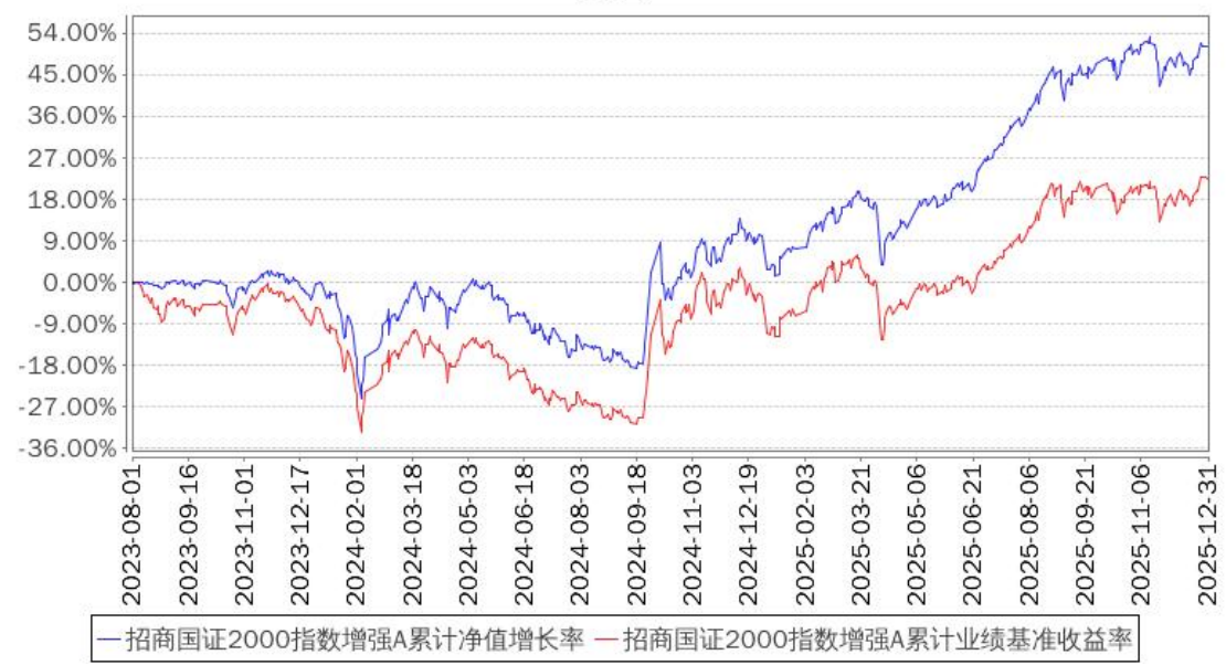
招商国证2000指数增强A累计净值增长率与同期业绩比较基准收益率的历史走势对比图