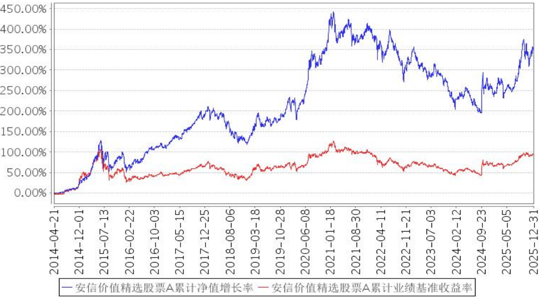
安信价值精选股票A累计净值增长率与同期业绩比较基准收益率的历史走势对比图