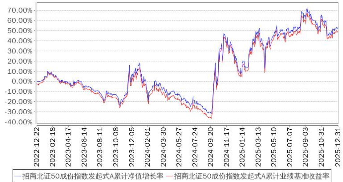
招商北证50成份指数发起式A累计净值增长率与同期业绩比较基准收益率的历史走势对比图