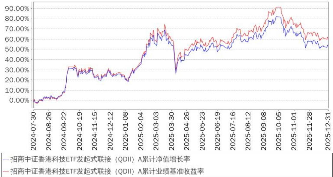
招商中证香港科技ETF发起式联接（QDII）A累计净值增长率与同期业绩比较基准收益率的历史走势对比图