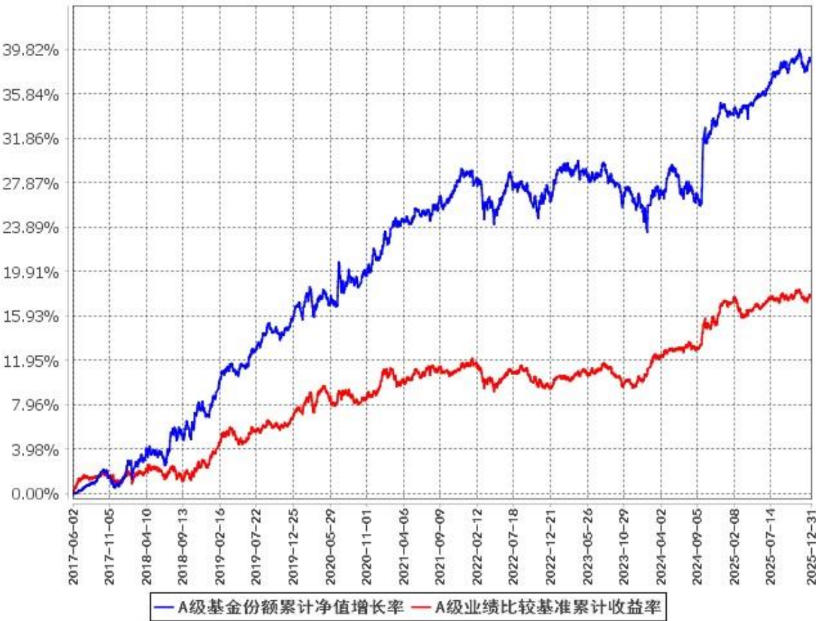
A级基金份额累计净值增长率与同期业绩比较基准收益率的历史走势对比图 (2017年6月2日至2025年12月31日)