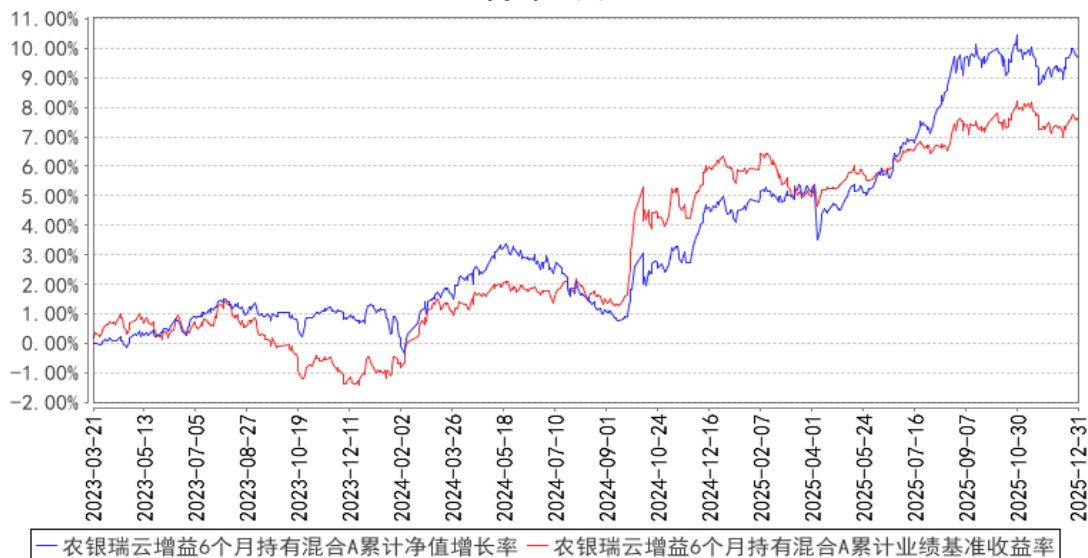
农银瑞云增益6个月持有混合A累计净值增长率与同期业绩比较基准收益率的历史走势对比图