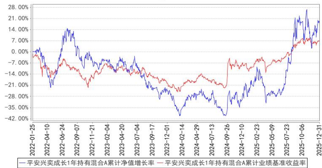
平安兴奕成长1年持有混合A累计净值增长率与同期业绩比较基准收益率的历史走势对比图