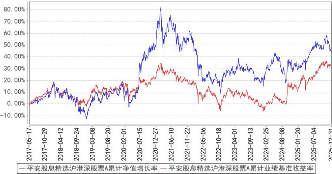
平安股息精选沪港深股票A累计净值增长率与同期业绩比较基准收益率的历史走势对比图