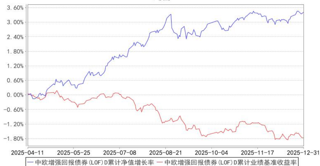
中欧增强回报债券（LOF）D 累计净值增长率与同期业绩比较基准收益率的历史走势对比图

注：本基金于 2025 年 3 月 26 日新增 D 类份额，图示日期为 2025 年 4 月 11 日至 2025 年 12 月 31 日。