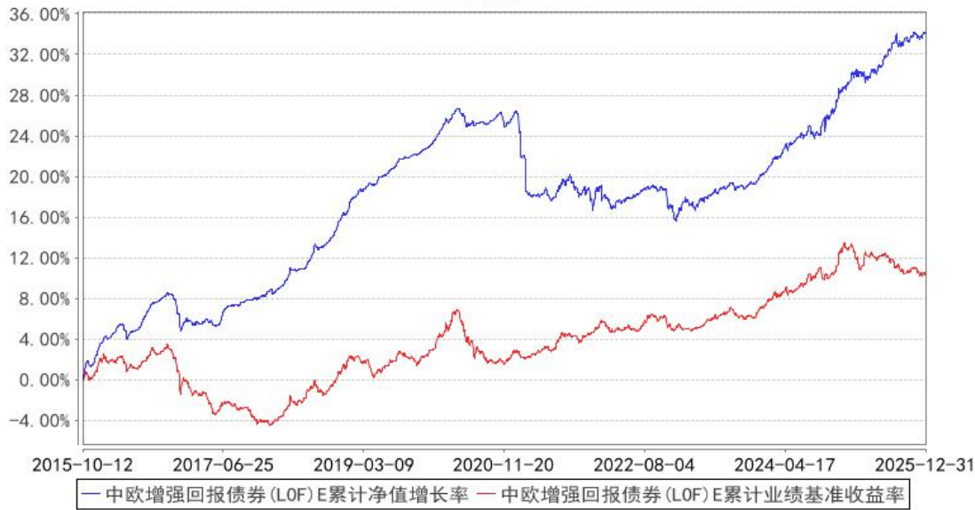
中欧增强回报债券（LOF）E 累计净值增长率与同期业绩比较基准收益率的历史走势对比图

注：本基金于 2015 年 10 月 8 日新增 E 份额，图示日期为 2015 年 10 月 12 日至 2025 年 12 月 31 日。