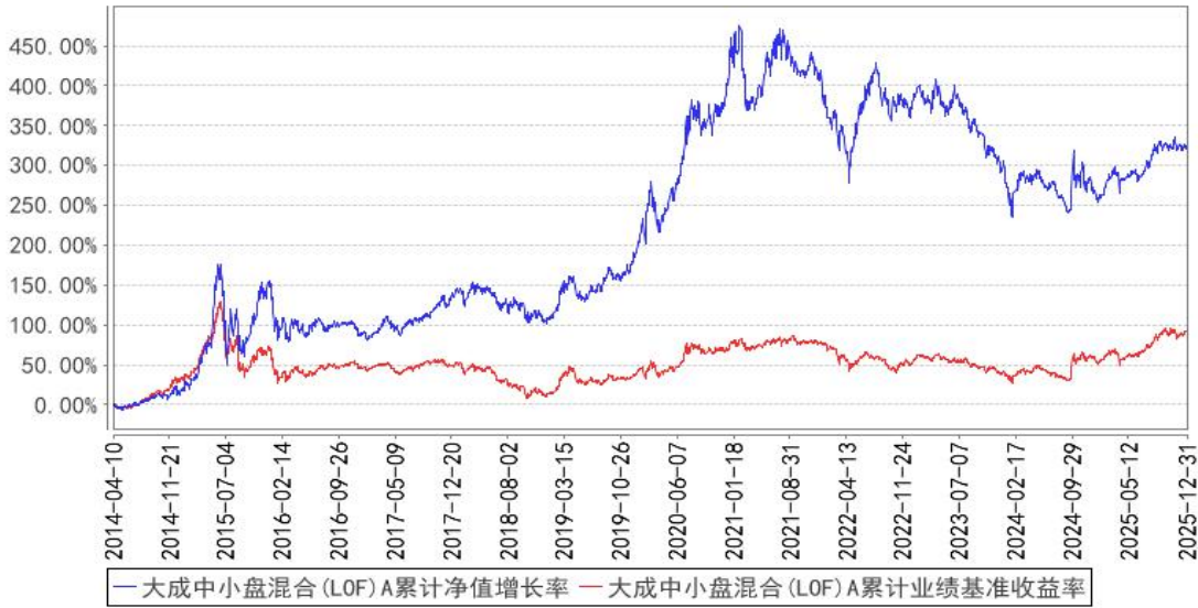
大成中小盘混合(LOF)A累计净值增长率与同期业绩比较基准收益率的历史走势对比图