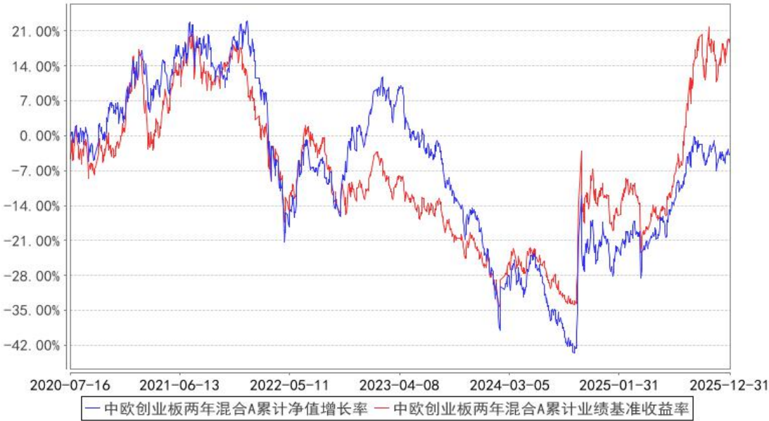
中欧创业板两年混合A累计净值增长率与同期业绩比较基准收益率的历史走势对比图