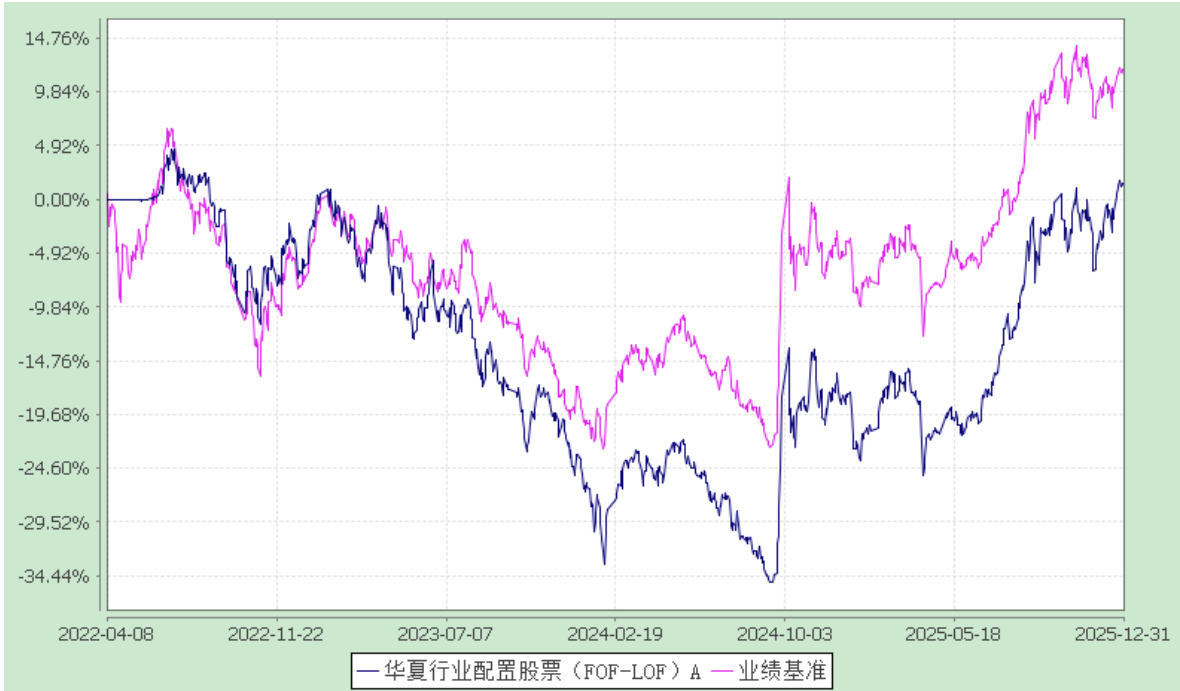
华夏行业配置股票（FOF）C: