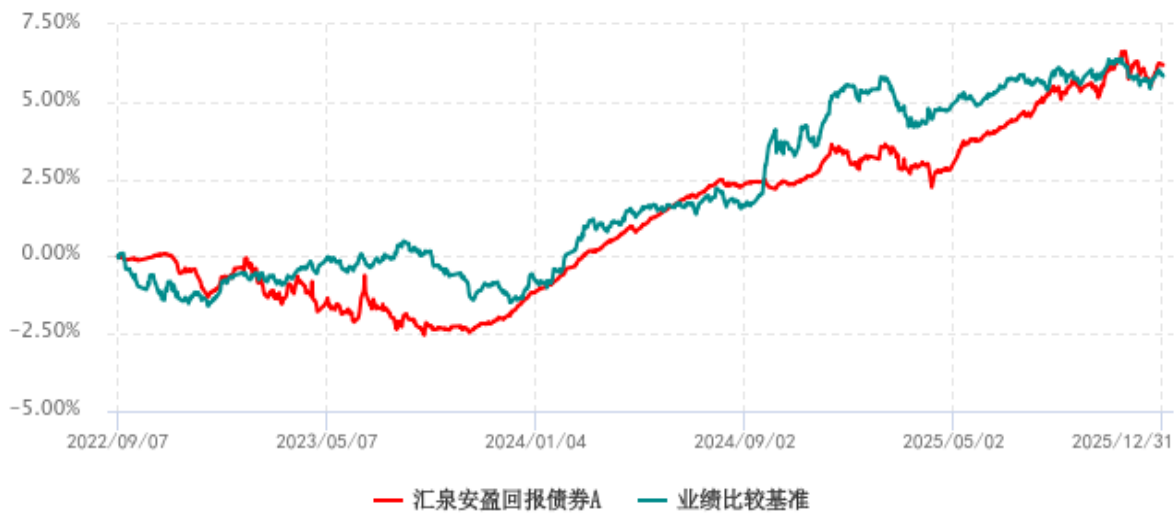
汇泉安盈回报债券A累计净值增长率与业绩比较基准收益率历史走势对比图 (2022年09月07日-2025年12月31日)