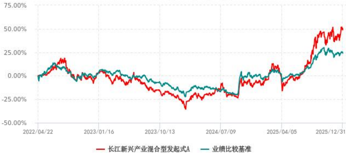
长江新兴产业混合型发起式A累计净值增长率与业绩比较基准收益率历史走势对比图 (2022年04月22日-2025年12月31日)

注：本基金的业绩比较基准自 2024 年 10 月 9 日起由“中证新兴产业指数收益率*75%+中债综合指数收益率*25%”变更为“中证新兴产业指数收益率*55%+中证港股通综合指