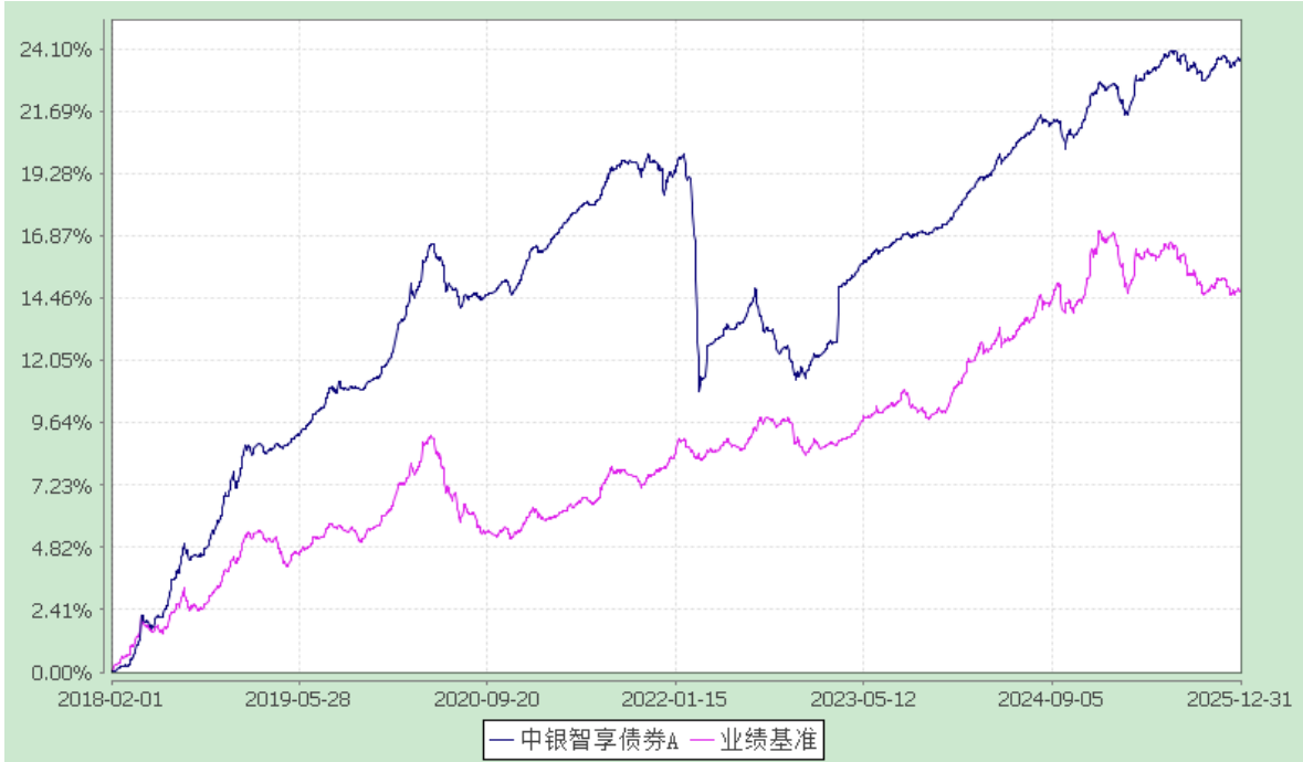
中银智享债券型证券投资基金 累计净值增长率与业绩比较基准收益率的历史走势对比图 (2018 年 2 月 1 日至 2025 年 12 月 31 日)