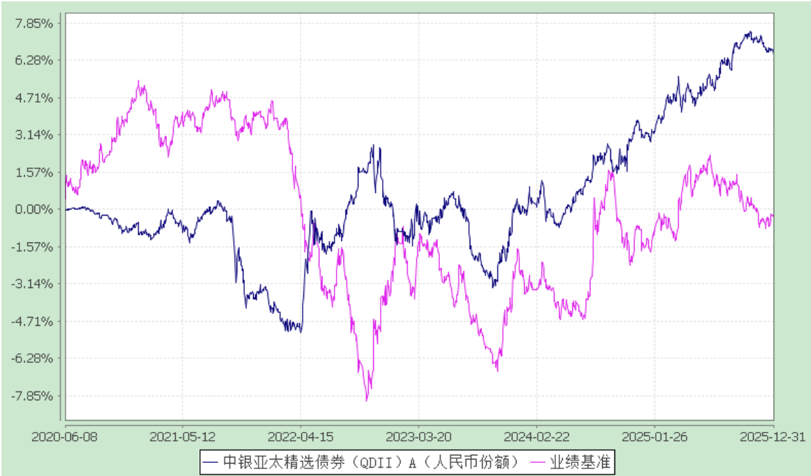
中银亚太精选债券型证券投资基金（QDII） 累计份额净值增长率与业绩比较基准收益率历史走势对比图 （2020 年 6 月 8 日至 2025 年 12 月 31 日）