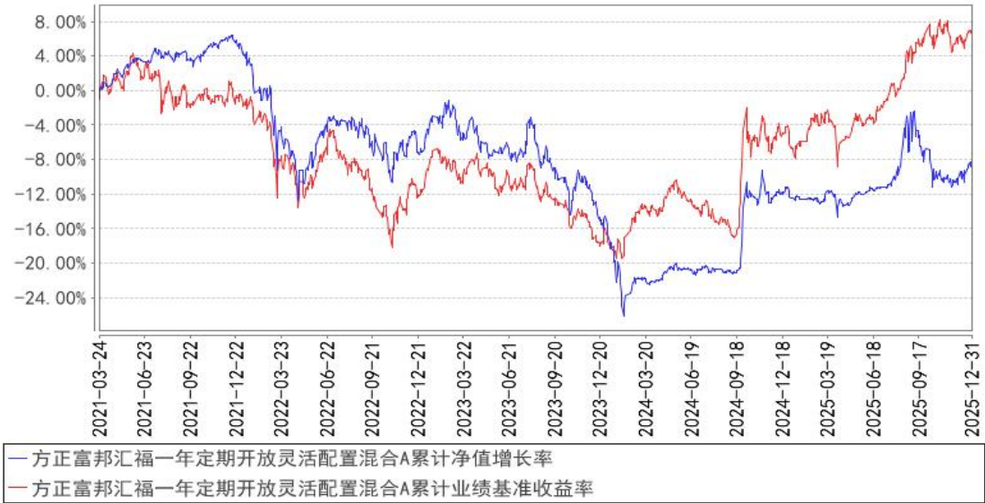
方正富邦汇福一年定期开放灵活配置混合A累计净值增长率与同期业绩比较基准收益率的历史走势对比图