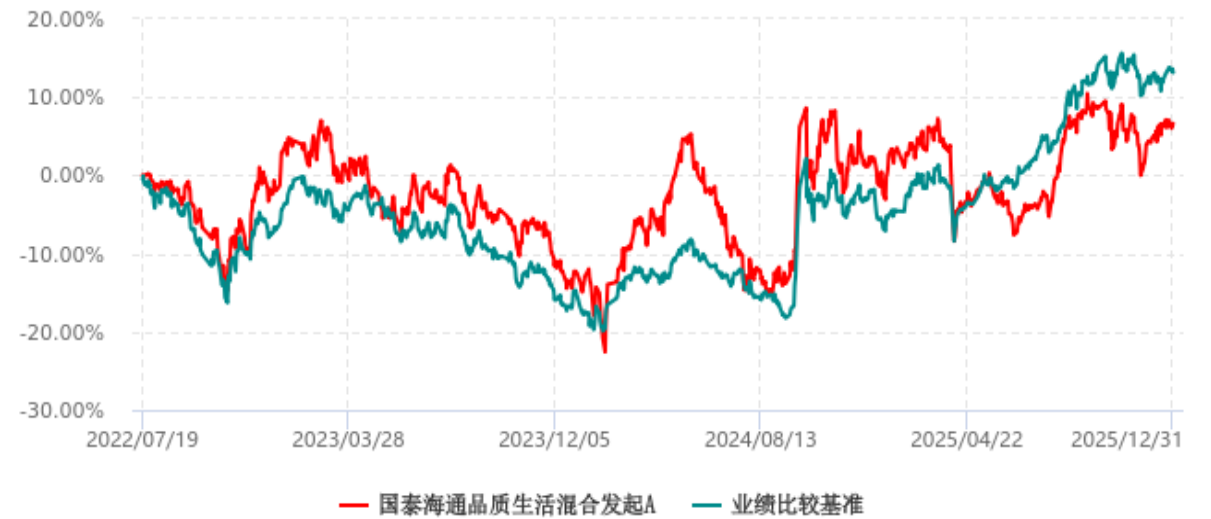
国泰海通品质生活混合发起A累计净值增长率与业绩比较基准收益率历史走势对比图 (2022年07月19日-2025年12月31日)