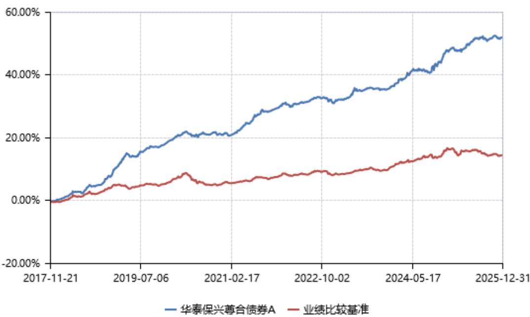
华泰保兴尊合债券 A