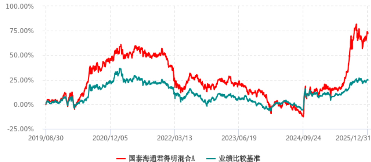
国泰海通君得明混合A累计净值增长率与业绩比较基准收益率历史走势对比图 (2019年08月30日-2025年12月31日)