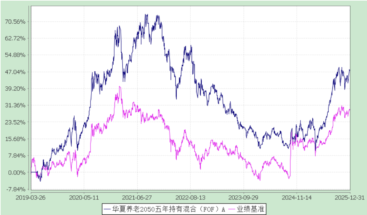
华夏养老目标日期 2050 五年持有期混合型发起式基金中基金（FOF） 累计净值增长率与业绩比较基准收益率的历史走势对比图 (2019 年 3 月 26 日至 2025 年 12 月 31 日)

②2022 年 11 月 16 日至 2022 年 11 月 28 日期间，华夏养老 2050 五年持有混合（FOF）Y 类基金份额为零。