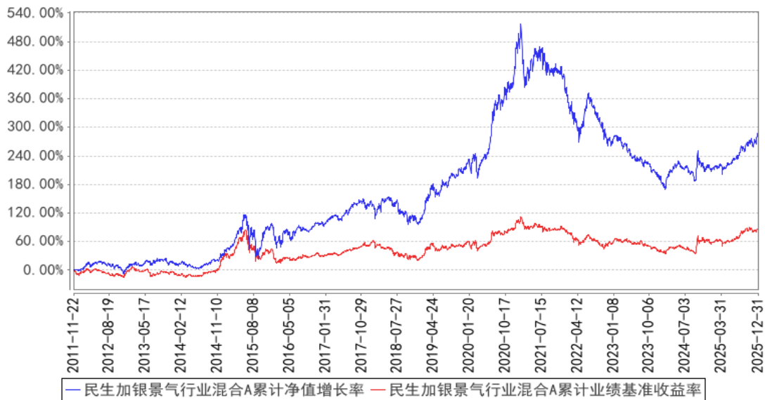
民生加银景气行业混合A累计净值增长率与同期业绩比较基准收益率的历史走势对比图