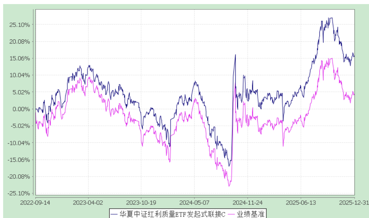
华夏中证红利质量 ETF 发起式联接 D: