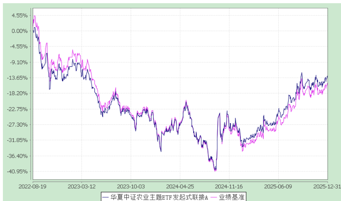
华夏中证农业主题 ETF 发起式联接 C: