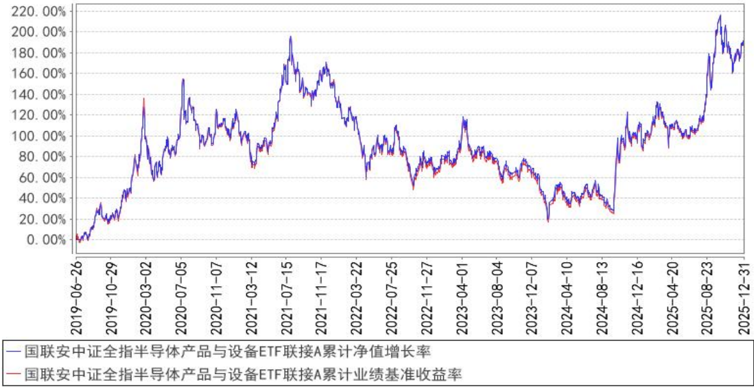
国联安中证全指半导体产品与设备ETF联接A累计净值增长率与同期业绩比较基准收益率的历史走势对比图

注：1、本基金业绩比较基准为中证全指半导体产品与设备指数收益率*95%+银行活期存款利率（税后）*5%；