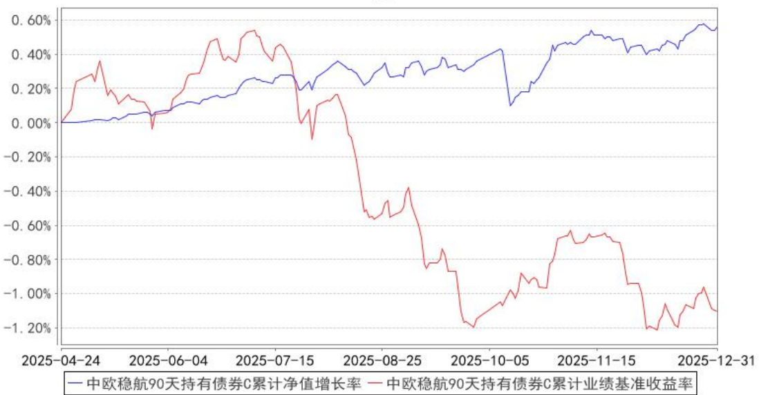
中欧稳航90天持有债券C累计净值增长率与同期业绩比较基准收益率的历史走势对比图

注：本基金基金合同生效日期为 2025 年 4 月 24 日，自基金合同生效日起到本报告期末不满一年，