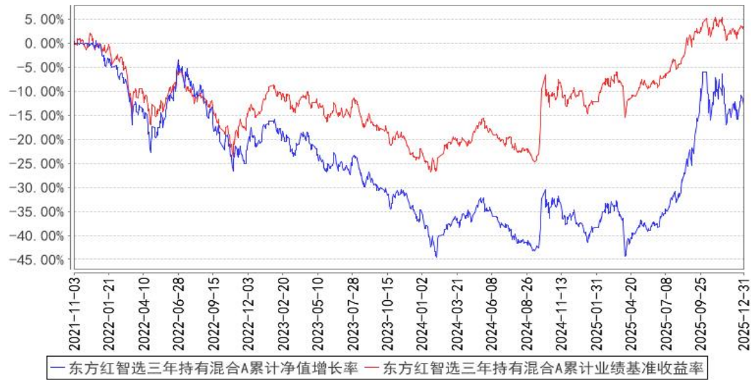
东方红智选三年持有混合A累计净值增长率与同期业绩比较基准收益率的历史走势对比图