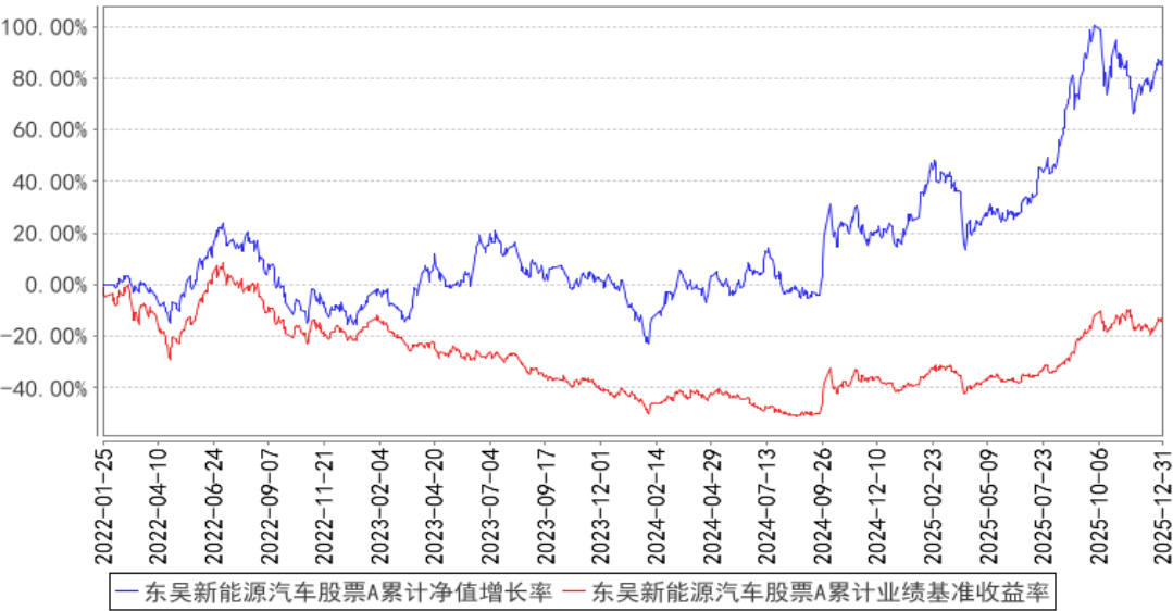
东吴新能源汽车股票A累计净值增长率与同期业绩比较基准收益率的历史走势对比图