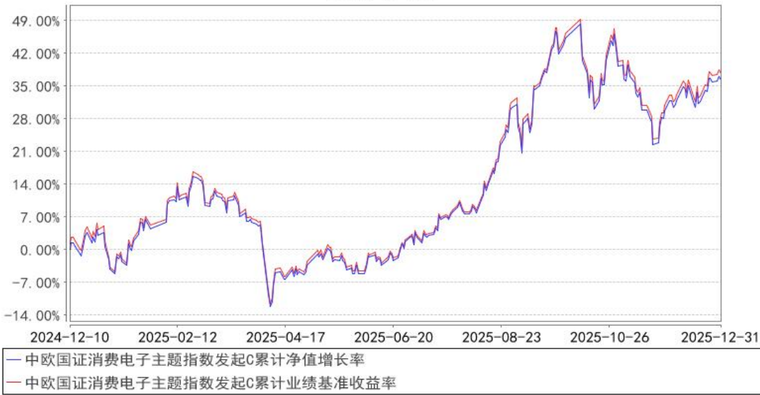
中欧国证消费电子主题指数发起C累计净值增长率与同期业绩比较基准收益率的历史 走势对比图

注：本基金基金合同生效日期为 2024 年 12 月 10 日，按基金合同的规定，本基金自基金合同生效起六个月为建仓期，建仓期结束时各项资产配置比例已经符合基金合同约定。