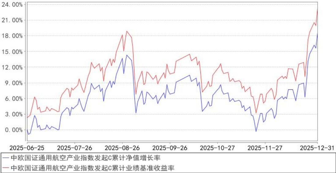
中欧国证通用航空产业指数发起C累计净值增长率与同期业绩比较基准收益率的历史 走势对比图

注：本基金基金合同生效日期为 2025 年 6 月 25 日，自基金合同生效日起到本报告期末不满一年，按基金合同的规定，本基金自基金合同生效起六个月为建仓期，建仓期结束时各项资产配置比例已经符合基金合同约定。