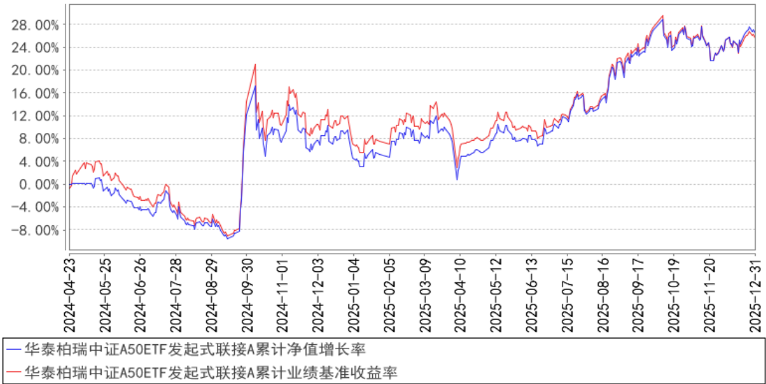
华泰柏瑞中证A50ETF发起式联接A累计净值增长率与同期业绩比较基准收益率的历史走势对比图