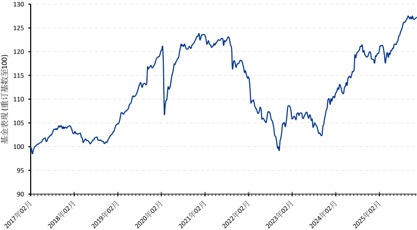
A 美元 (累积)(仅供参考，不代表其他份额表现)