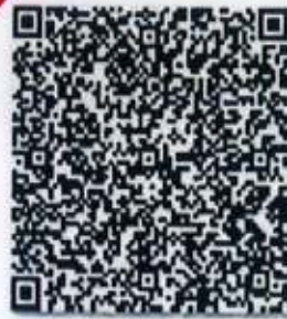
原证的年检二维码

证书经检验合格, 继续有效一年。 This certificate is valid for another year after this renewal.