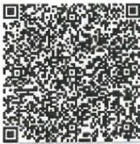
郝光伟的年检二维码.png

本证书经检验合格, 继续有效一年。 This certificate is valid for another year after this renewal.