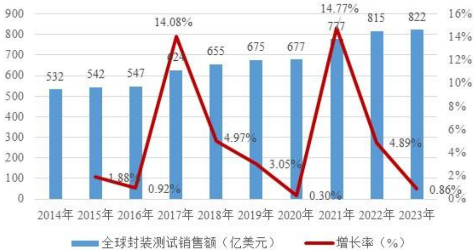
全球封装测试销售额及增长情况

根据中国半导体行业协会信息显示，2023 年全球封测市场规模为 822 亿美元，同比增长 0.86%。未来，全球半导体封装测试技术将继续向小型化、集成化、低功耗方向发展，在新兴市场和半导体技术进步的共同带动下，附加值更高的先进封装将得到越来越多的应用，封装测试业市场有望持续向好，预计 2026 年市场规模有望达 961 亿美元。