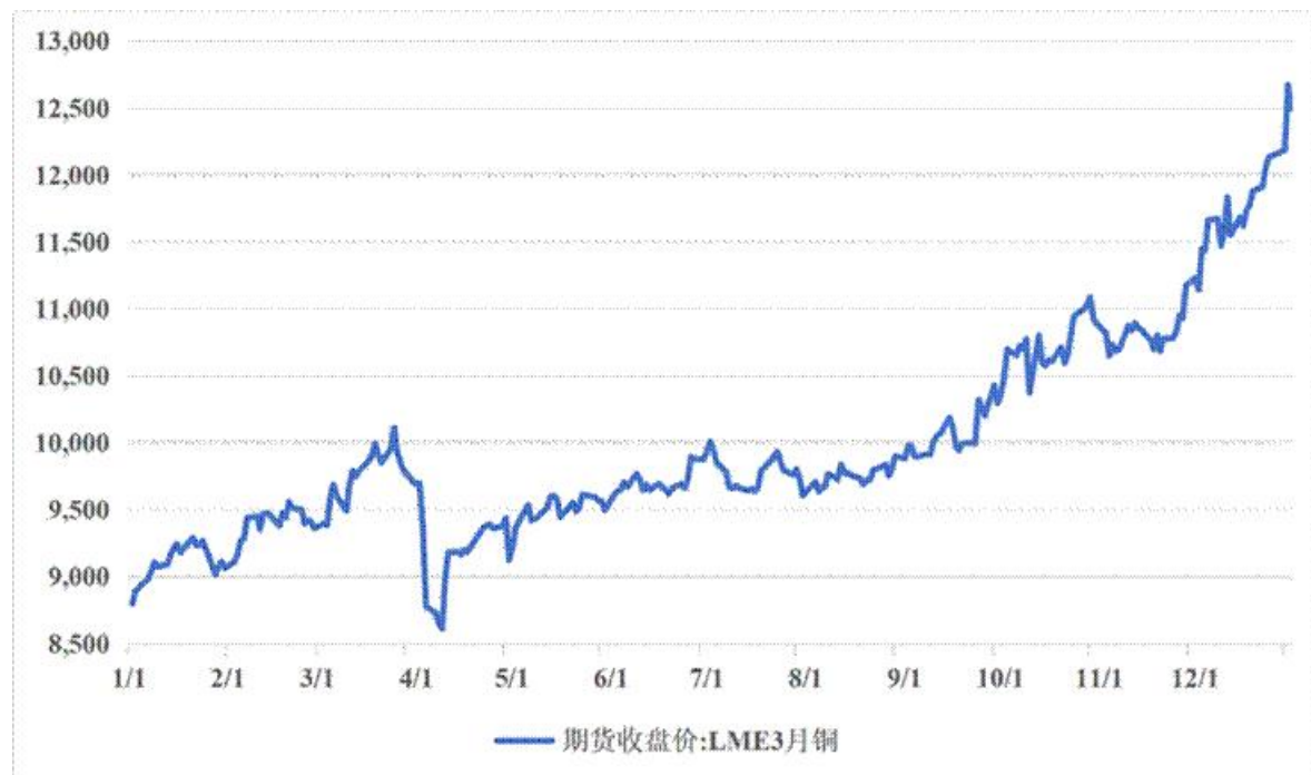
图 2-1 2025 年铜价格走势 (单位: 美元/吨)

2025 年，铜价在多重因素交织影响下呈现震荡上行走势。从供给端看，全球铜矿供给整体偏紧的格局延续。受矿山品位下降及突发事件影响，全年铜矿产量增量不及年初预期。从需求端看，铜消费保持相对韧性。首先，电力基础设施升级作为铜消费的基石，其投资持续增长，为铜需求提供了最稳固的基本盘。其次，家电“以旧换新”等促消费政策靶向发力，叠加新能源汽车相关支持政策延续，共同对铜材需求形成了有力支撑。此外，以数据中心为代表的新型基础设施投入加大，正在为铜需求开辟新的结构性增量。