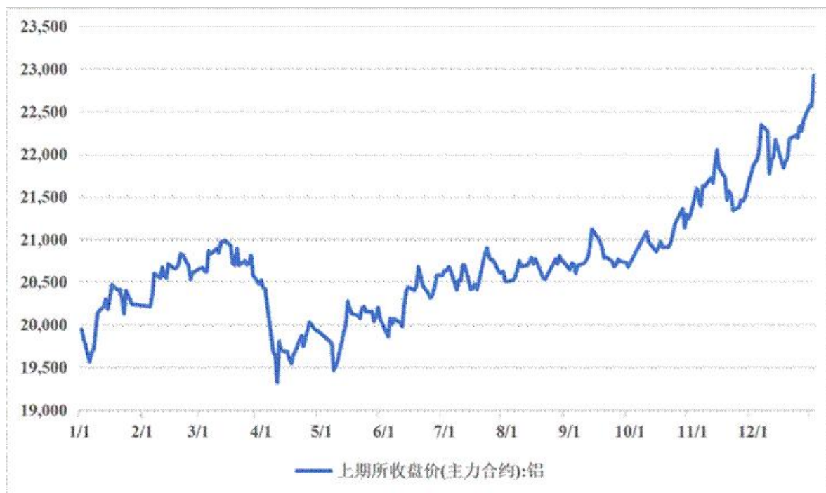
图 2-2 2025 年铝价格走势 (单位: 元/吨)

2025 年铝价中枢整体向上。供给方面，海外几内亚回收采矿证加剧矿端扰动风险，氧化铝新增产能集中释放致使库存保持高位，电解铝国内产能临近天花板刚性约束，海外新增产能落地节奏缓慢。需求方面，光伏及特高压铝线缆需求稳定支撑铝价，出口表现尚可，上半年国内去库趋势明显，下半年铝价上涨压制需求，整体库存有一定的累库趋势。