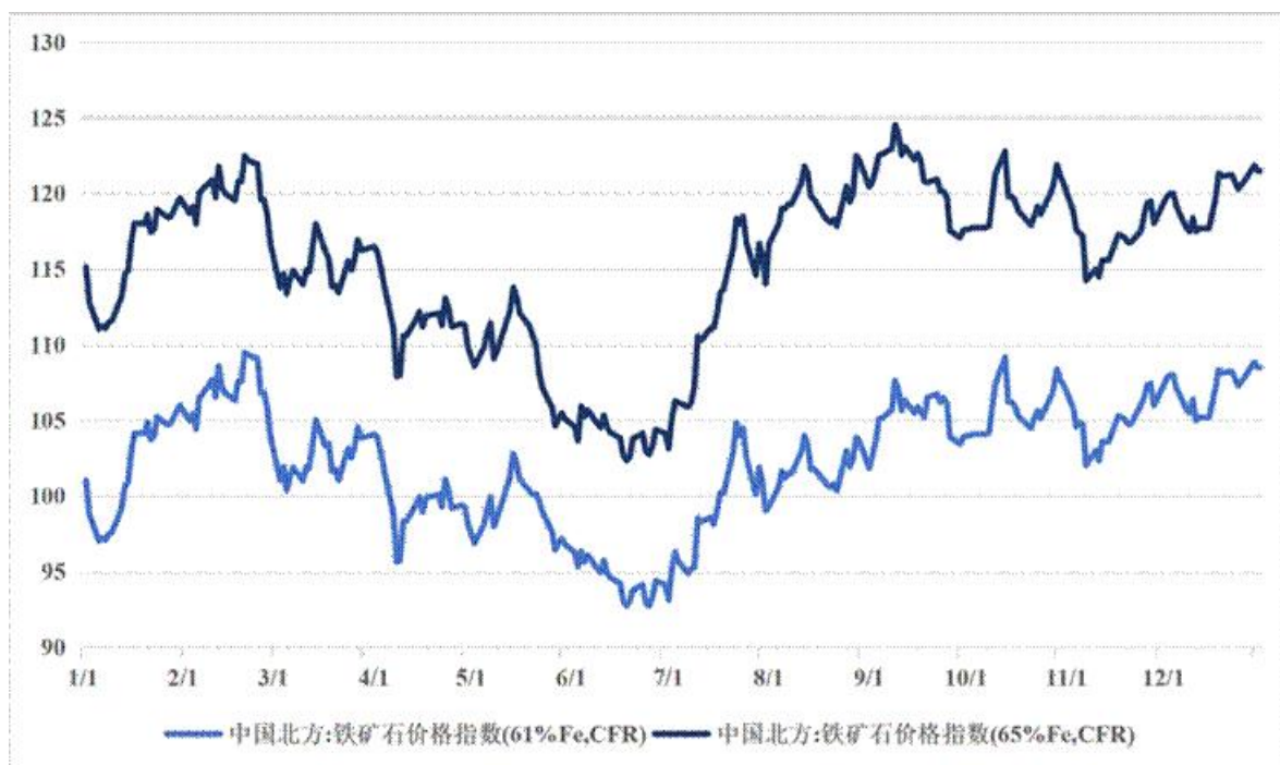
图 2-3 2025 年铁矿石主要标的价格走势（单位：美元/吨）