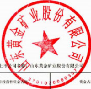
2025年度非经营性资金占用及其他关联资金往来情况汇总表