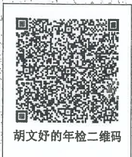
胡文好的年检二维码

本证书经检验合格，继续有效一年。 This certificate is valid for another year after this renewal.