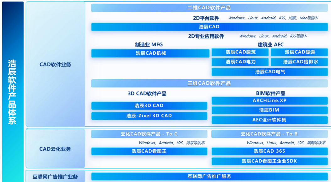
图 1：浩辰软件主要业务及产品体系

展望 2026 年，公司将继续深耕工业软件主航道，聚焦 CAD 核心领域，推进 2D、3D、BIM 及云化产品的协同发展，深化“云+端”融合，围绕全球化战略、一体化设计解决方案、三维 CAD 加速布局，推进 B 端与 C 端业务双轮驱动，积极布局 AI 与 CAD 的技术融合。在 CAD 软件方面，公司将继续强化全球化研发协同、生态合作与市场拓展，提升品牌影响力，以外延式发展深度布局三维 CAD 领域，不断提升国产工业软件的国际竞争力；在云化领域，以 C 端超 1 亿用户为基础进一步拓展中小企业云服务，不断拓展“云”“端”协同的边界，驱动营收规模与经营质量同步提升。