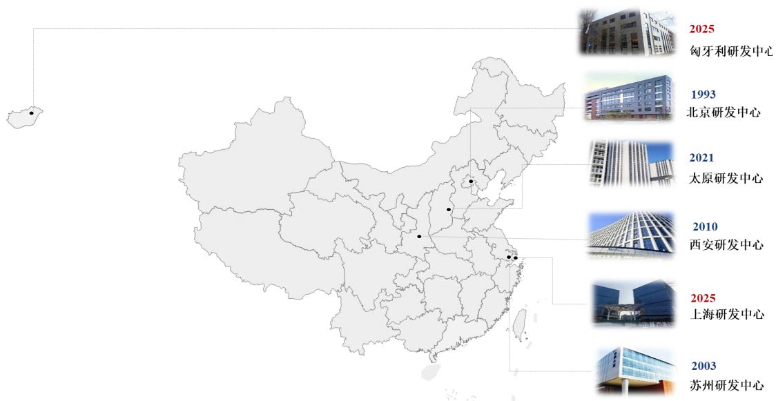
图 3 浩辰软件全球协同研发体系

公司始终聚焦国产工业软件自主创新，坚持“产品自主可控+适配国产操作系统”。2025年，公司构建了覆盖国内外主流操作系统的CAD平台产品体系，为不同行业和应用环境提供统一、稳定的技术底座，提升了产品在多操作系统和多硬件环境下的可用性与一致性。其中Linux版全面适配统信、麒麟等国产系统及龙芯、鲲鹏芯片，不仅为信创场景提供了安全可靠的基础，保障境内用户设计生产数据安全可靠，更推动从“设计”到“制造”的全链条自主可控，融入工业