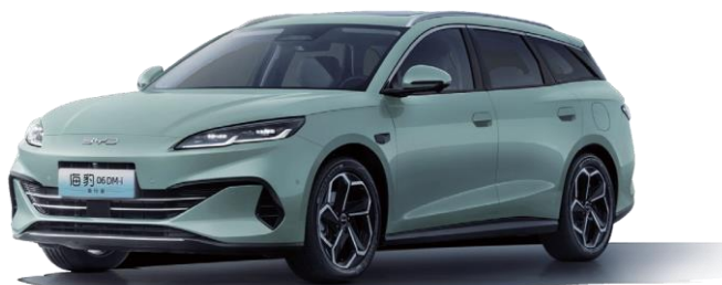
「海豹 06DM-i 旅行版」

七月正式上市，兼具轿车灵动驾控基因及SUV级宽适大空间，全系标配「第五代DM技术」及「天神之眼C」辅助驾驶系统，搭载「云辇-C」智能阻尼车身控制系统，全面颠覆旅行车体验标准，树立新能源时代全球旅行车风向标。