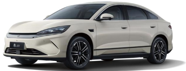
「秦 L EV」

三月正式上市并于八月加推云辇型，基于「e平台 3.0 Evo」打造，标配「天神之眼C」辅助驾驶系统，采用前双球头麦弗逊、后五连杆独立悬架，加推「云辇-C」智能阻尼车身控制系统并同级首搭「TBC」高速爆胎稳行系统，树立操控安全双标杆。