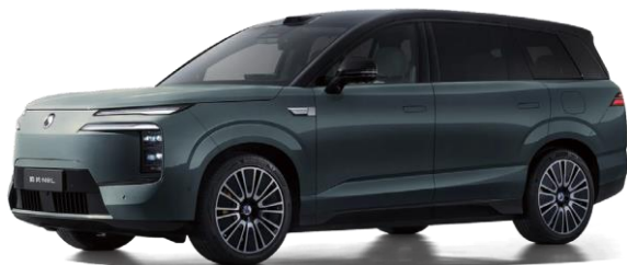
「腾势 N9/腾势 N8L」

「腾势N9」三月上市、九月焕新，「腾势N8L」十月接力上市，以硬核科技安全，分别深耕旗舰性能与家庭出行。双车均基于「易三方」技术平台打造，全系标配「云辇-A」智能空气车身控制系统、「天神之眼B」辅助驾驶系统、插混专用2.0T高效发动机及三电机，均实现3.9s零百加速、210km/h鱼钩测试高速避让不侧翻、180km/h高速爆胎不失稳，并配备定眩智能防晕车系统、车位到车位领航辅助等智能舒适配置。「腾势N9」作为全尺寸旗舰，具备4.65m极致转弯半径，二排支持双向横向调节，可选四座行政版，荣获中汽中心「2025中国十佳底盘」、「最佳智能奖」双料权威认证；「腾势N8L」以「超安全家庭大六座、超豪华移动大平层、超智能科技大座驾」精准聚焦家庭场景，上市月余即达成15,000辆下线。