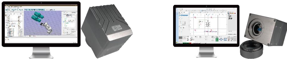
图2: 柔性智造解决方案