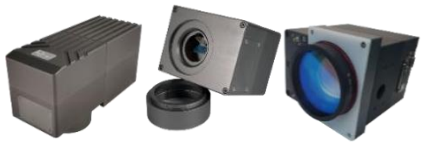
图5：高精密振镜-G3系列