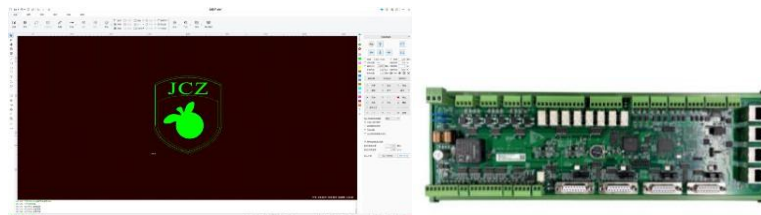
图4: CutMaker软件、MCS系列控制卡

在激光伺服控制系统方面，公司根据客户需求，持续研发，在提升系统效能与拓展高端应用两大主线取得关键突破。核心部件效率与智能化方面实现显著提升，新一代智能调高器通过优化电容式传感器融合算法，实现对复杂板材的更高精度跟随与实时自适应，穿孔成功率和切割头保护效率有效提升。切割路径规划算法完成迭代。研发了新一代全局路径规划引擎。优化了单一板材的切割顺序与空程路径，缩短了加工时间，实现了对多零件共边切割与余料矩阵的自动高效排版，板材综合利用率获得实质性提高。半导体行业精密切割领域取得初步突破。针对玻璃、陶瓷基板等脆性材料，公司开发了超快激光（皮秒、飞秒）精密加工控制模块。通过集成高精度形变补偿算法，以及微米级精度的运动平台协同控制，将加工精度提升至10微米以内，满足了半导体制造特定环节的精细切割需求。