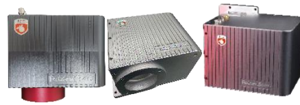
图6：高精密振镜-捷隼系列

在激光精密加工设备方面，公司主要采取定制化生产方式，受益于市场需求的提升，销售收入相较2024年有所增加。公司精密激光调阻设备在医疗传感器、工业传感器、航空航天等领域持续获得客户订单，并为国内外客户提供了多项定制化解决方案。除此之外，公司努力开拓新的市场方向，经过多年的持续研发和技术积累，公司自主研发的晶圆激光修调设备、脉冲调阻设备均已交付客户。未来，公司将聚焦市场需求，结合自身技术优势，继续在精密激光调阻、微纳加工、半导体精密设备等领域深耕细作，为行业客户提供更多优质解决方案。