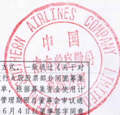
2020 年非公开发行 A 股股票：2025 年度募集资金使用情况对照表（续）